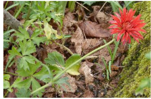
Anemone hortensis subsp. Pavonina vers Chastanet << Ci contre le talus vertical de Bellet au fond de la vallée de Planchetorte, avec la petite fougère : Anogramma leptophylla , Saxifraga granulata , des riccias, fossombrossias, rebouliaas ...

Sortie Jardin sauvage le 8 mai 2016 sur les pelouses du causse corrézien vers le lieu-dit La Ménagerie, situé à cheval sur les communes de Châteaux et de Saint-Cernin-de-Larche ; Voici une liste non exhaustive des espèces rencontrées, seules les espèces rarement observées ou patrimoniales du milieu caussard ont été retenues : Asteraceae : Carduncellus mitissimus (L.) DC.; Carduus nigrescens Vill.; Crepis foetida L.; Inula conyza (Griess.) DC.; Inula montana L. ; Boraginaceae : Lithospermum purpureocaeruleum L. Brassicaceae : Arabis hirsuta (L.) Scop. ; Caryophyllaceae : Minuartia hybrida subsp. tenuifolia (L.) Kerguélien Fabaceae : Argyrolobium zanonii (Turra) P.W.Ball ; Ervum gracile (Lois.) DC. ; Lathyrus sphaericus Retz. ; Lathyrus nissolia L ; Medicago polymorpha L. ; Medicago rigidula (L.) All.; Trifolium scabrum L. Geraniaceae : Geranium robertianum subsp. purpureum (Vill.) Nyman Lamiaceae : Ajuga genevensis L. ; Teucrium botrys L. ; Orchidaceae : Ophrys fuciflora (F.W.Schmidt) Moench Plantaginaceae : Veronica teucrium L. qui semble être une nouvelle espèce pour la Corrèze